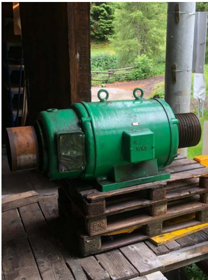
Motor Breitsteglift