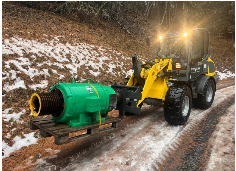
Transport Motor